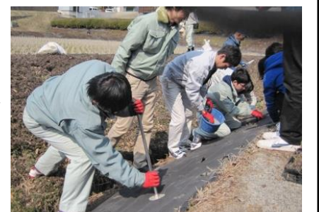
芝桜植栽風景です

畔の急な斜面での草刈り作業はお年寄りにとつて大変な重労働で、作業中の転落事故は命の危険と隣り合わせです。草刈り作業の労力を減らすために、防草シートを法面に張り、そこに芝桜を植えたことで、