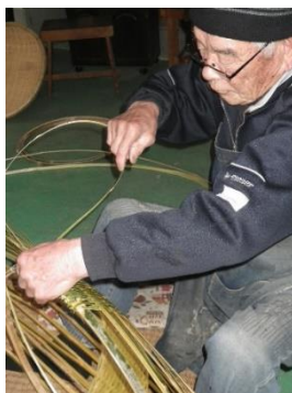
「そうけ」を編んでおられます。完成するまでに3日かかるそうです。