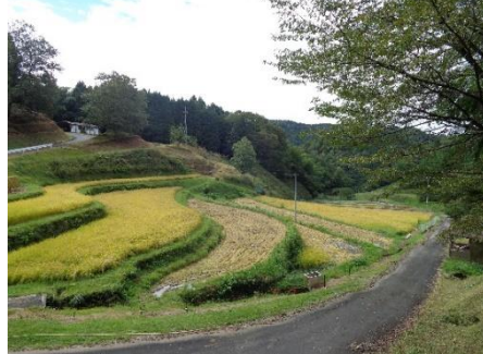
大道理 新畑東地区の秋の田園風景です

この恵まれた自然環境を地域住民はもとより、都市の多くの人々と共に四季を通じ五感で感じあえる交流を回り、活力と生きがいのある大道理、そして子や孫に引き継げる地域づくりを目指します」