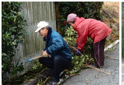
【便利屋事業での作業風景】高齢者のご自宅の庭木を剪定中です！