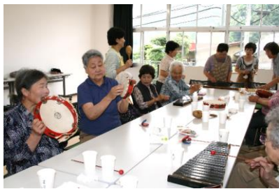
【高齢者サロンの様子】皆さん楽しい時間を過ごされています