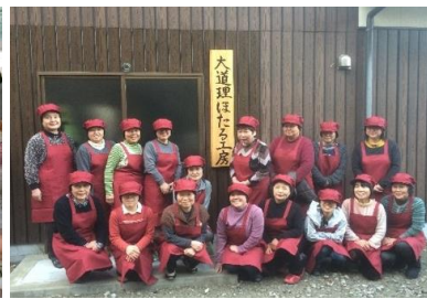
【大道理ほたる工房の皆さん】