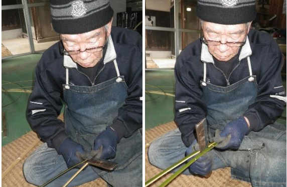
皮と身の部分とに分けておられます