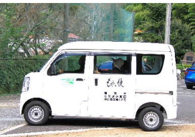
【生活交通もやい便】