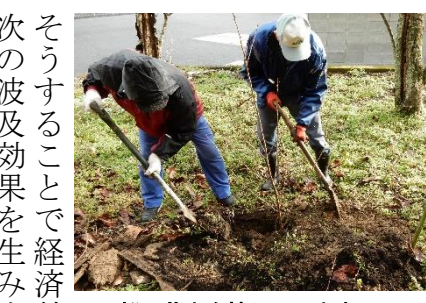
桜の苗木を植えています！

そうすることで経済効果も生みだせました。次の波及効果を生み出すものとして、今年の四月一日完成予定で、芝桜会場に、蒔蒔づくり、豆腐づくりなど農業体験ができる施設を建設中です。(平成二十八年二月現在)