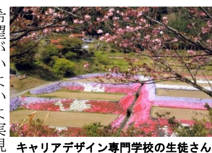
キャリアデザイン専門学校の生徒さんがデザインされた「八代のツル」

希望がいよいよ実現しつつあります。漫画家、デザイナー目線で地域を見るとまた違ってきます。新しいことにどんな挑戦して、輪を広げていくことが大切です。