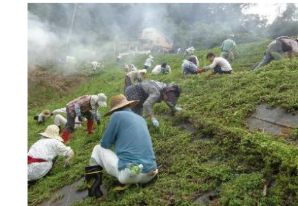
芝桜の草刈り作業風景。傾斜の急な斜面での作業です（8月 百笑俱樂部）

向道環境保全会は、一haの棚田法面の維持管理の労力低減のため、マルチ被覆を施し、芝桜十萬本を植栽しました。この取り組みの中で、都市部の住民の方と交流し、そこが憩いの場、癒しの場となり、開花時期には、毎年四万人の方が訪れる事などが評価されました。これだけでなく、芝桜の取り組みにより、地域が元気になり、お年寄りを対象とした便利屋事業、高齢者サロン、生活交通もやい便等の活動が始まり、地域住民が運営する活動拠点、夢求の里交流館が設立され、地域活動における様々な面での波及効果を生んだことが大きく評価され、今回受賞の運びとなりました。