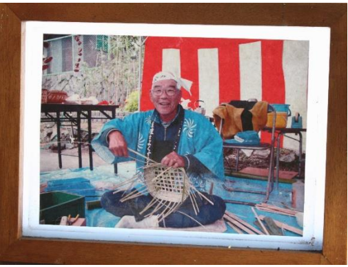
ルーラルフェスタでの竹細工実演の様子