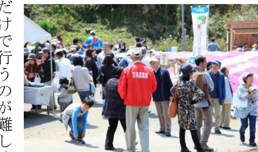
芝桜まつりでのにぎわいの風景です

だけで行うのが難しくなり、地域全体へと広がり、段々と地域活動の幅が広がっていききました。そのことが夢プランの実現へと前へ向いていこうと進み始める足がかりとなつて、ほたる工房ができ、生活交通のもやい便が始まっていく端緒となりました。