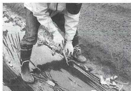
芋の苗植え体験中

植えた翌日から日照りが続き、苗が数本しおれたと思ったら、今度は一転大雨で畑に水が溜まってしまい管理の大変さを実感しています。