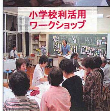
小学校利活用 ワークショップ