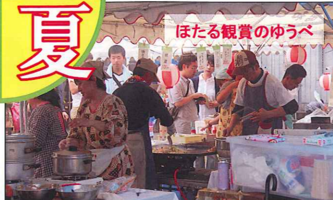
ほたる観賞のゆうべ