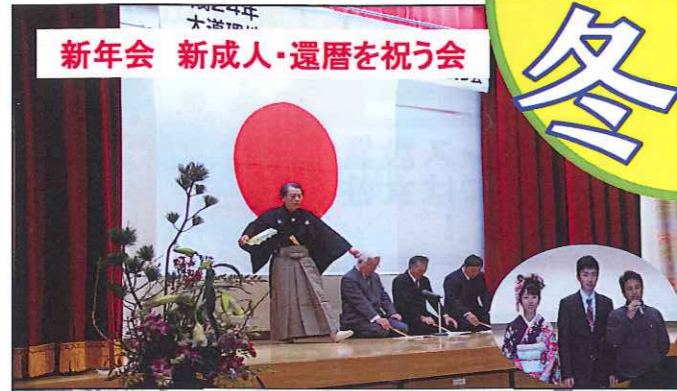
新年会 新成人・還暦を祝う会