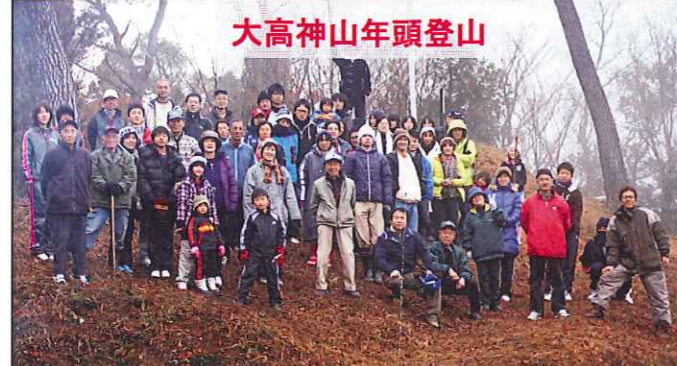
大高神山年頭登山