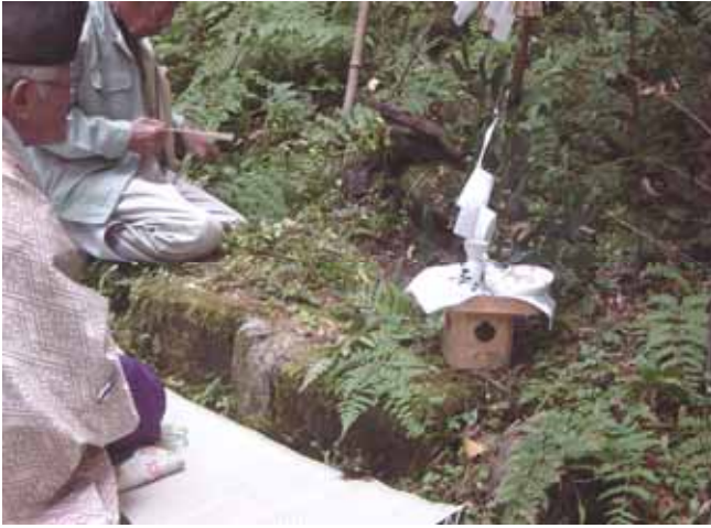
『木片を壺の中に入れて水の量を測る』