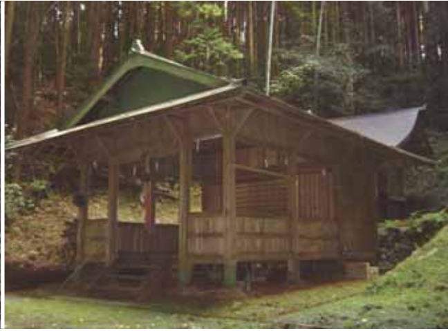
『とても静かで神秘的な空間の中にある大番社』