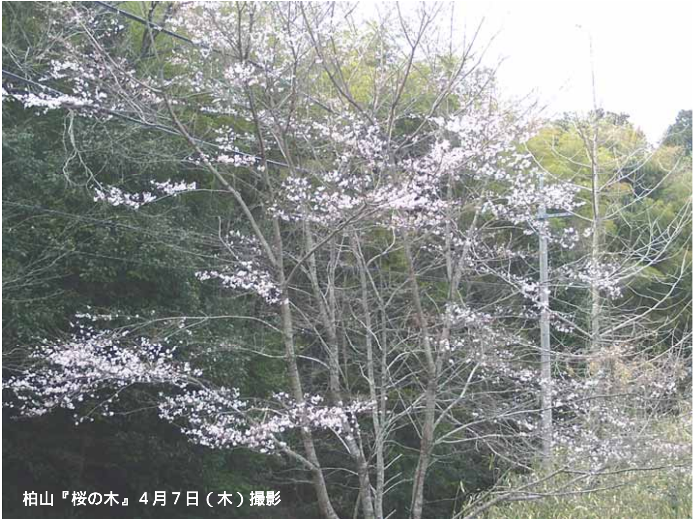
柏山『桜の木』4月7日(木)撮影