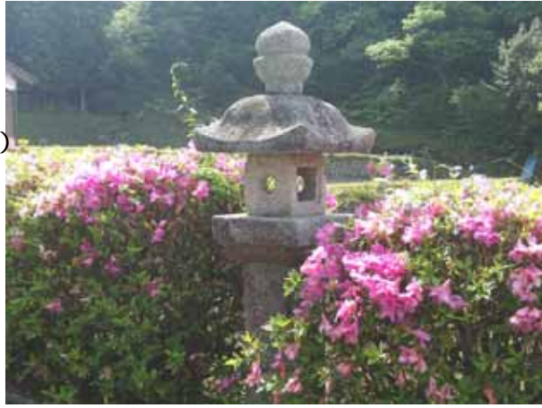
『中須八幡宮石灯籠』