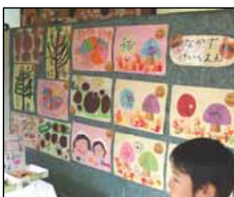
産業文化祭『作品展示室』