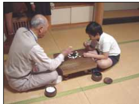
『う～ん、なかなかやるなあ...』

公民館も「まちの先生」も子どもたちも、みんなが戸惑いながらも、スタンプでできた教室をきっかけとして、あなたがたの地域づくりにつなげていきたい。そんな熱い想いを持って、みなさんに支えられ、