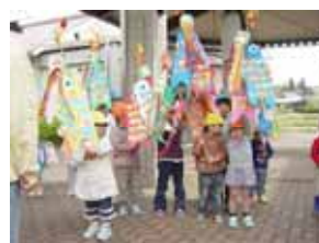
中須保育園の園児たち 「うまくできたかな?」