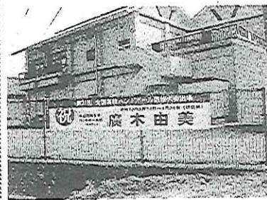
中須支所入口に張られた横断幕