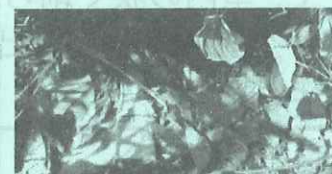
まだゴミが残っている...