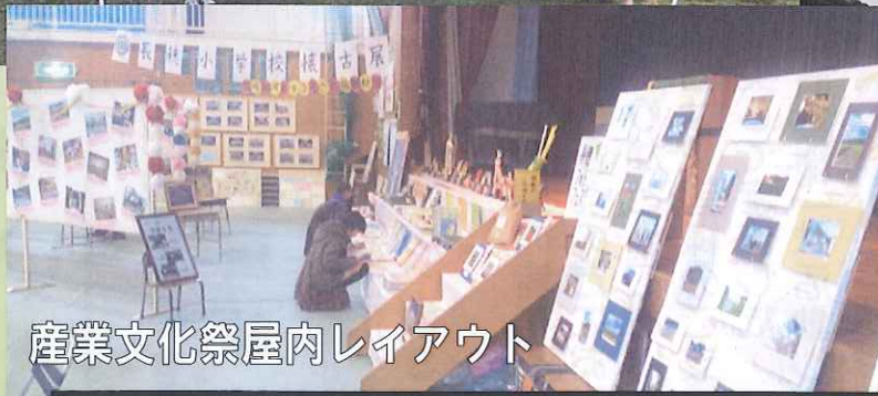
産業文化祭屋内レイアウト