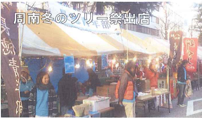
周南冬のツリー祭出店