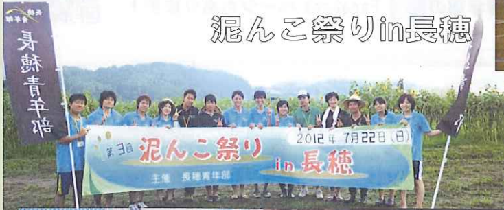
泥んこ祭り in 長穂