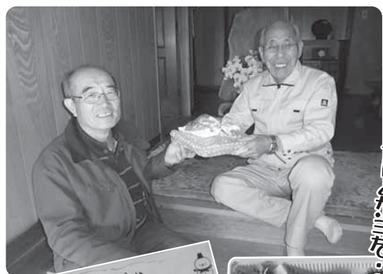
心を込めて おいしい手作り弁当を。

訪問すると、「ありがとう。楽しみにしていたよ。」と喜んで頂きました!(*^_^*)