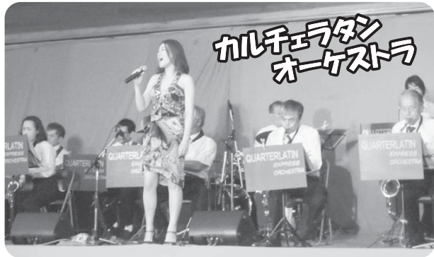
カルチェラタンオーケストラ