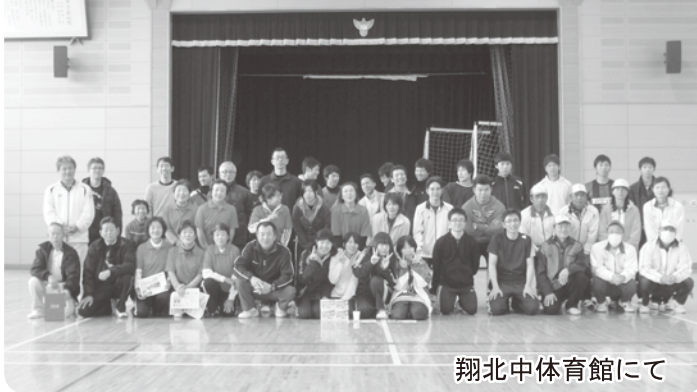
翔北中体育館にて

3月23日(日)翔北スポーツ交流会実行委員会(大道理・大向・長穂体育振興会・翔北中OB会)が主催で、翔北スポーツ交流会が開催されました。当日の参加者は約50名で、武術太極拳(準備運動)から始まり、体力測定(握力、立ち幅跳び、反復横跳び等)、カローリング、シャッフルボードといった、ボリューム満点の内容で、若い方からお年寄りの方までたくさん運動されました。昼食には大道理地区の女性の方々にカレーライスを準備して頂きました。運動した後の外でみんなと食べるご飯は格別で、大変好評でした。