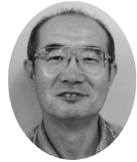
長穂地区社会福祉協議会

盆踊り大会は、8月14日午後6時から、長年地区のためにご尽力くださった方、「活力のある長穂に」と熱い思いを語っていた彼など、惜しまれながら他界された12名の物故者の追悼式を行い、7時から盆踊り大会をします。