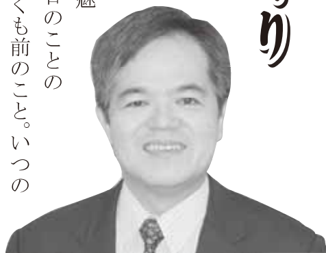
社団法人 日本ユネスコ協会連盟(組織部長)

僕がまだピッカピカの一年生だった頃、長穂の小学校から蒔地への帰り道は、毎日ワクワクする魅力であふれていた。それはつい昨日のことのように思えるが、今やもう50年近くも前のこと。いつの間にか、僕も歳をとったものだ。