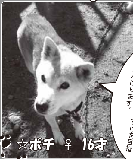
☆ポチ ♀ 16才