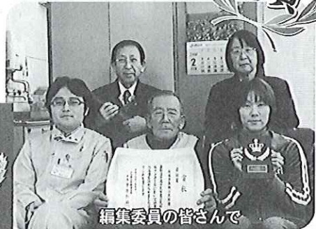
編集委員の皆様さんで

県の公民館報コンクールで「私達の長穂」が奨励賞に選ばれました。入賞は9年ぶりです。