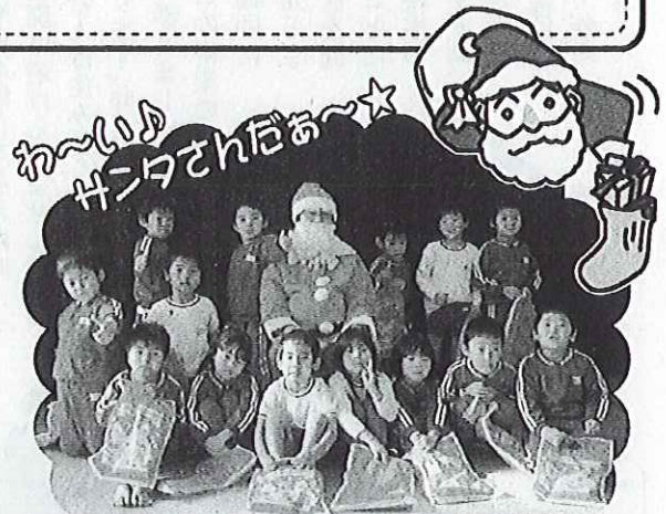
12月19日(火)、児童園でクリスマス会が開かれ、楽しいひとときをすごしました。