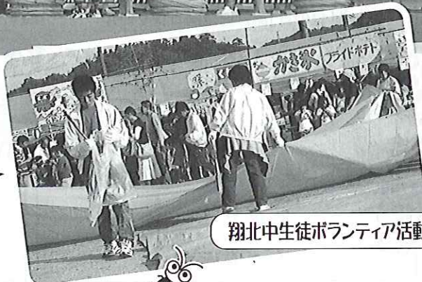
翔北中学生ボランティア活動