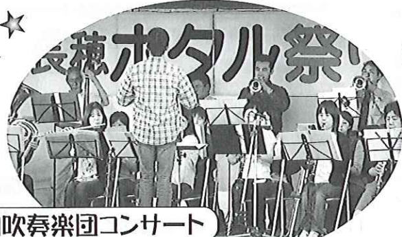
徳山吹奏楽団コンサート