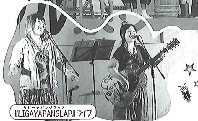
リガーヤパングループ 『LIGAYAPANGLAP』ライブ