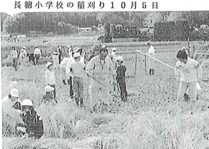
長穂小学校の稲刈り10月5日