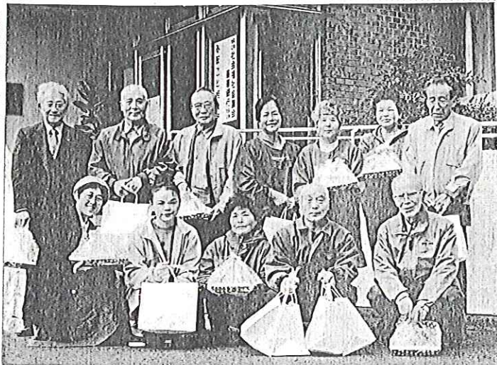
絵画の寄贈によせて