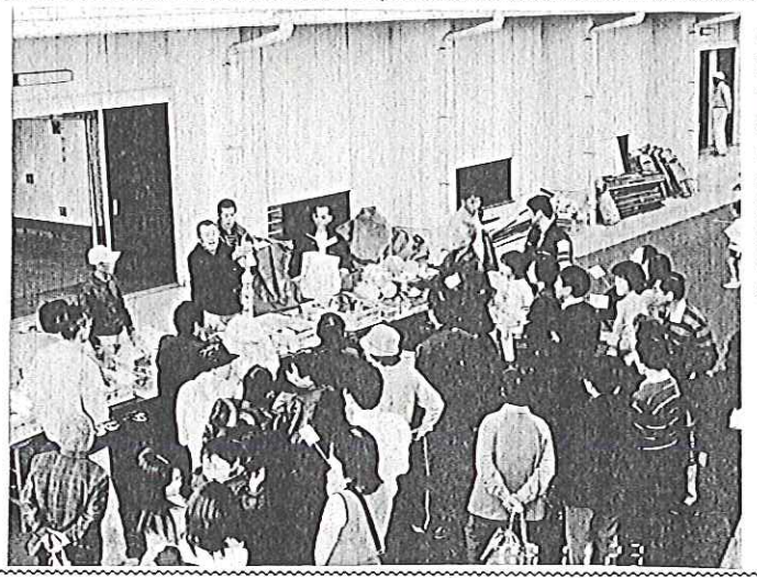
農作物の競売風景