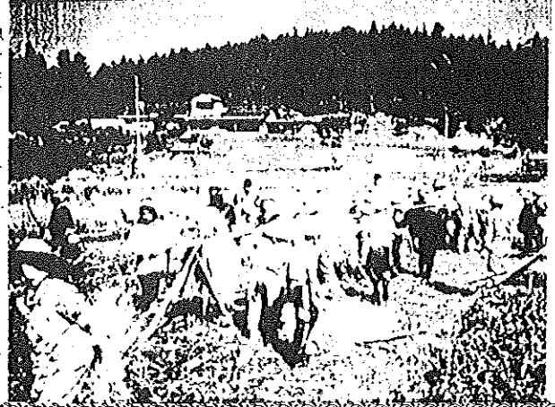
小学校・長寿会のおれあい福刈り。10.9