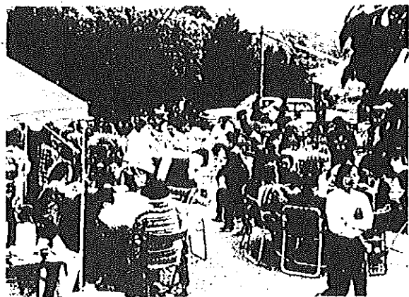
オ二三回産業文化祭の一助です