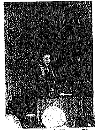
96.1.20 老人大学の一 野

先日は大変お世話になりました。竜文寺のぞうきんがけをしながら、このお寺は四百年間も、長穂で大切にされ、長穂の人々を見ながらかげで守って来たんだらうなと思っていました。四百年という長い間、竜文寺を大切に保存する事は大変な事だと思います。また、座禅を初めて組んだり、コーンがゆを頂いたり、私にとって大変貴重な体験になりました。座禅を組んでいる時、私は頭の中を真っ白にしよう