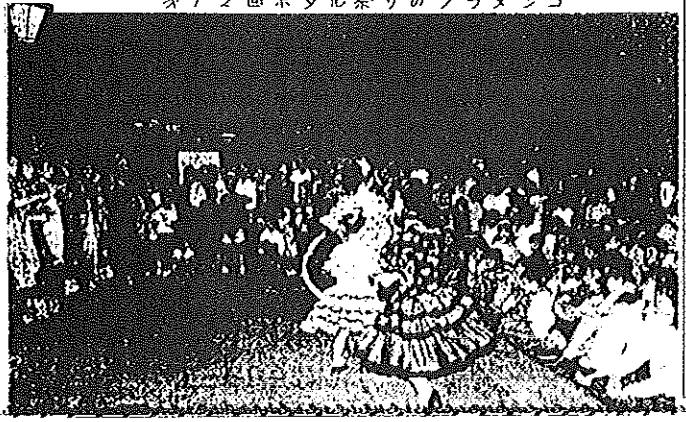
★1/2回ホテル祭りのフラメンコ

公民館文庫にベストセラー中心の新刊 二十六冊が入庫いたしました。 皆さまのご利用をお待ちしています。