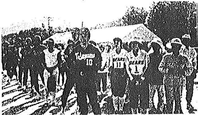
北部球技大会出場の長穂選手団の皆様です。