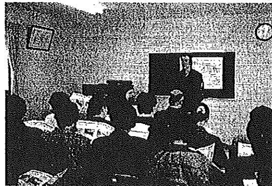
リサイクルセンターで作業行程の説明も聞く

来や教員等一切伺いません。一株でも二株でも結構です、有難く頂戴いたしますので何卒ご準備の程を、よろしくお願い申し上げます。