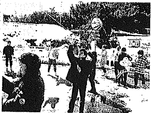
国際交流セミナーでの風上げ

当日は、地区栄養推進員さんと長寿会会員のみなさんご指導で、日本の田舎料理と風作りでの交流学習をしました。前日からの積雪で留学生も雪だるまを作ったりと大喜び。日本の味と文化に加えて長穂の雪景色で、より印象深い一日になったことでしょう。