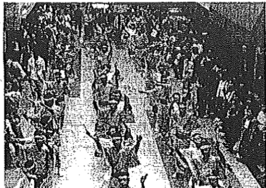
のんた祭・長穂シヤギリ隊の徳山四奉音頭