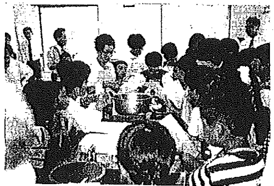
ふれあい料理教室の一助です。

会食の席で自分達で作った料理だと、あの飲みの類、類、類感動の一言です。長寿会の皆さんも多数ご参加頂き、ご指導ご協力頂きました。子供さん達は大変面白く愉快に勉強出来ましたこと、いつまでも記憶に残る