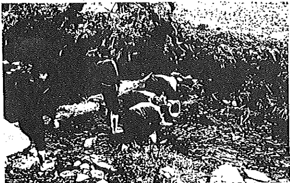
中学生ホタル幼虫放流風景（新地川）へ、11月5日 約1万匹を、