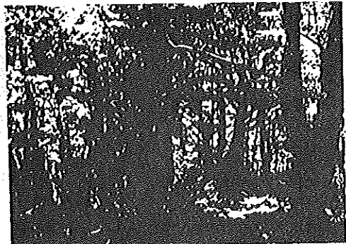
写真は踏み入れた当初の頂上付近