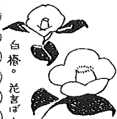
白椿。花言葉は... 完成された愛情 理想の恋