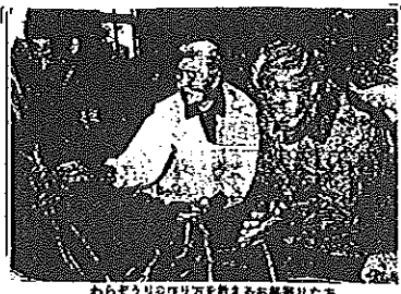
わらざり作り寺などがある。