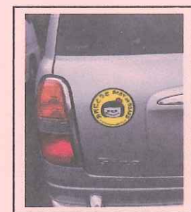
キッズステッカー 車に貼るとこんな感じ