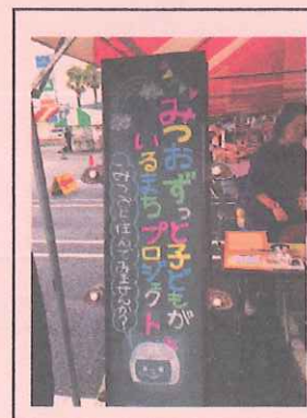
素敵な看板でお出迎え

9月6日(日)下松市ザ・モール周南で行われた、周南青年会議所主催の「タウンプランニングフェスタ」というイベントに、「みつおずっと子どもがいるまちプロジェクト」の産業部会が中心となって出展しました。このイベントは青年会議所管内の地域づくりをしている団体の紹介と交流を目的に行われたものです。我がプロジェクトでは、イベントとしてブースでキッズステッカーの販売と子ども向けのアルミ風船づくり、また移住に関する相談の受付や三丘の紹介コーナーを設けました。立ち止まって説明を聞いて下さる方も多く、空き家のことを詳しく聞かれる方もいらっしゃいました。生憎の雨模様でしたが、対外的なPRの第1段としては、うまくいったのではと思います。今後も様々なイベントでプロジェクトの紹介をしていきたいと思っています。