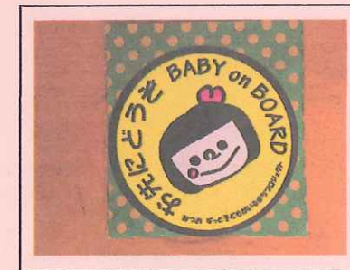
「赤ちゃんが乗ってます」 黄色でかわいいデザイン