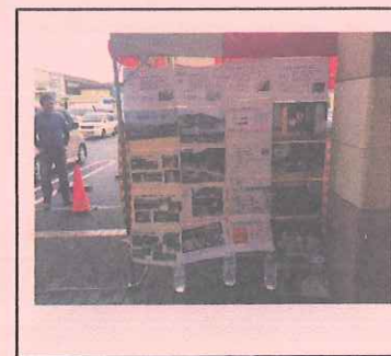
手作りの三丘紹介コーナー 見られる方も多かったです