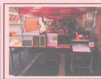
プロジェクトのブースの様子です アルミ風船づくりは小さなお子さんに大好評 でした