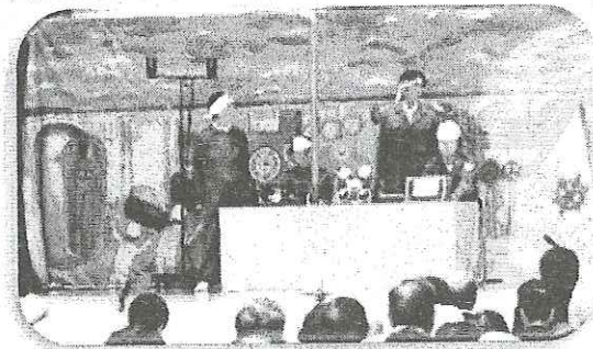
八千代座歌舞伎 演題 「大津島散華(回天)」