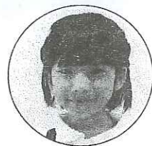
わたしのおばあちゃん