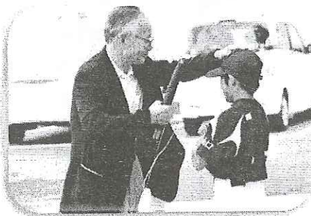
小学生手作り ペンダントに感激 ありがとうございます!

第414号 ・榊浜地区コミュニティ推進協議会 「広報部」 ・榊浜公民館 ☆記事と情報は下記まで TEL 25-0555 数字で見る榊浜 人口 5,968 (男性 2,862人) (女性 3,106人) 2,661世帯 8月末現在