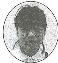
いつもありがとう