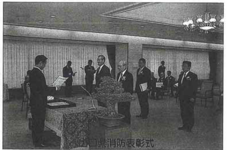
山口県消防表彰式