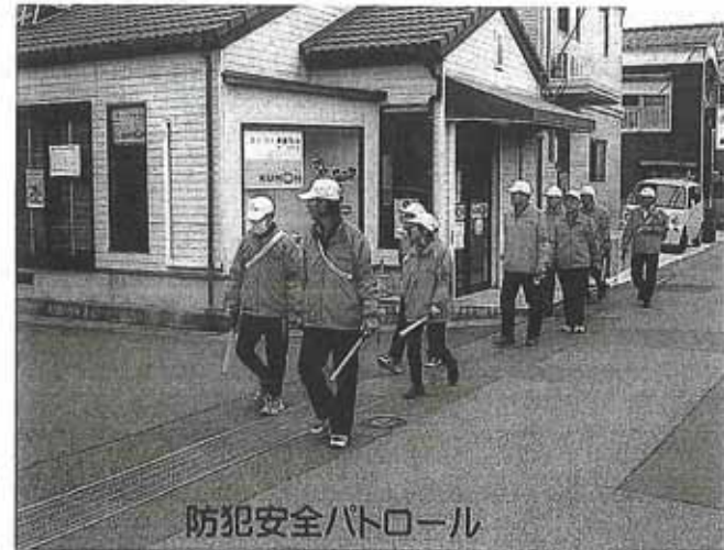
防犯安全パトロール

三月二十二日市庁舎に木村市長を表敬訪問し受章の報告をしました。市長からもお祝いとお励みのお言葉を頂きました。