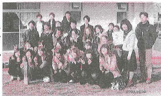
タイムスリップ！ タイムカプセル掘り 起こし・・・！ 出てきた宝物は？

また、たくさんの愛情を注いでくださった方々がいます。時には、うまく気持ちを受け止めることができず、衝突したこともありました。しかし、成人を迎えた今、様々な形で支えられてここまで成長することができたのだと心から素直に思えます。だからこそ、これまで私を支えて下さった全ての方々に「ありがとう」の一言を伝えたいのです。私にとって、この周南で出会った全ての人たちは、永遠の誇りです。さて私には、マスコミ関係の仕事に就き、世の中に真実を伝えたいという夢があります。夢は、二十歳の私たちを強くし、