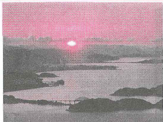
☆山頂からの初日の出☆

今年、山頂でうどん・甘酒の接待がありました。今年も素晴らしい年でありますように！