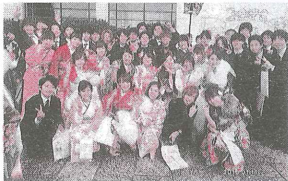
新成人誓いも新たに勢揃い

観光客も多く訪れる国際的な都市です。私の生活において、周りの環境・人、全てが変わりました。そのため、ふとした時に地元のことを思い出し、なつかしくなります。私は、周南を出たことにより、改めて故郷の大切さを知ったのです。本日、成人式を迎えるにあたって、ここで過ごした日々が思い出されます。無邪気にはしゃいでいた幼稚園の頃、たくさん勉強し、遊んだ小学生の頃、思春期を迎え、様々な経験をした中学生の頃、部活や勉強、行事