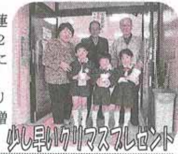
少し早いクリスマスプレゼント

12月4日(金) 蓮生まこと幼稚園、22日(火) 榊浜保育園に地区社会福祉協議会、自治会連合会からクリスマスプレゼントが贈られました。