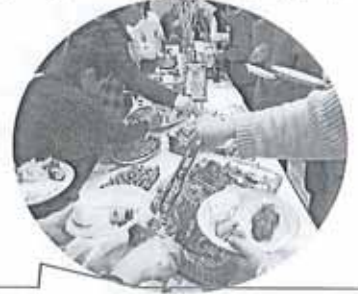
レストランのバイキングに勝る豪華食事に舌鼓

なったことから多くの自治会長や講座グループからの参加もあり、百二十名の出席者が和やかな雰囲気と交流を深めることができました。