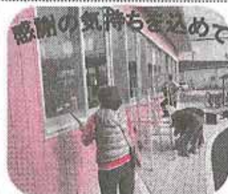
感謝の気持ちを込めて

12月18日(金) 講座グループ、地域諸団体、約100名が参加し大掃除が行われました。床の水拭き窓拭きなど隅々までピカピカになりました。ありがとうございました。