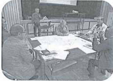
Disaster (災害)、 Imagination (想像力) Game (ゲーム)