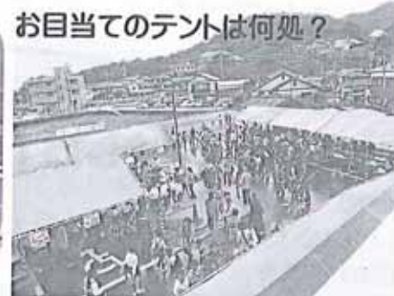
お目当てのテントは何処?