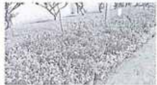
平成27年度 市花壇コンクール (学校の部) 榊浜小学校PTA ・学級花壇 「奨励賞」受賞

いつも自分を見守り支えてくださっている家族の方の思いを時には振り返ってみると、自分には多くの人のお陰で生活できていることに気づくことができます。思います。このような感性をしっかりと育み、心から相手の人に感謝する気持ちをこれからもしっかりと養っていききたいと思えます。