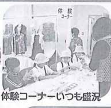
体験コーナーいつも盛況