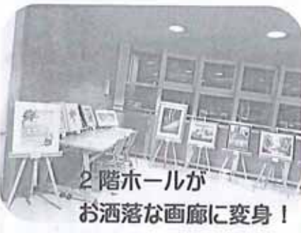
2階ホールが お洒落な画廊に変身!