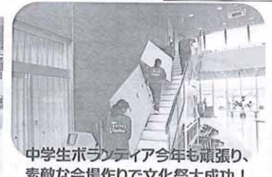
中学生ボランティア今年も頑張り、 素敵な会場作りで文化祭大成功!

今年度の文化祭は、櫛浜地区のコミュニティ推進活動が櫛浜公民館へ移管統合され、新しいコミュニティ推進活動の最初のイベントとなりました。皆様の文化祭開催の熱意のお蔭で、開催当日は曇り一時雨の中、ご来賓と会場にあふれんばかりの多くの方々をお迎えして『くしがはま絆の集い櫛浜地区文化祭』を開催致しました。