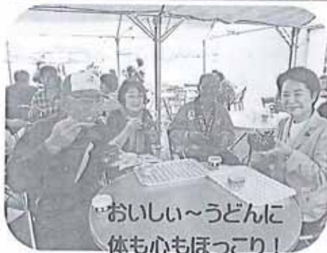
おいしい〜うどんに 体も心もほっこり!

第404号 櫛浜地区コミュニティ推進協議会 「広報部」 「櫛浜公民館」 ☆記事と情報は 下記まで TEL 25-0555 数字で見る櫛浜 人口 5,958人 (男性 2,844人) (女性 3,114人) 2,634世帯 10月末現在