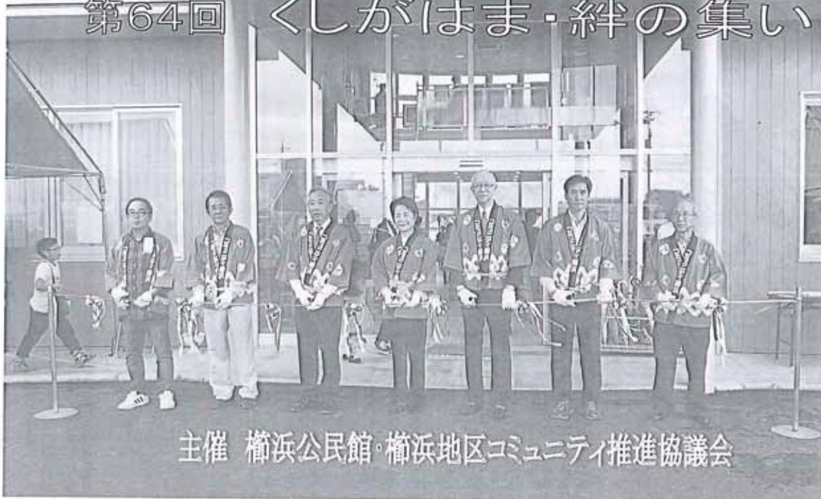
主催 櫛浜公民館・櫛浜地区コミュニティ推進協議会

第404号 櫛浜地区コミュニティ推進協議会 「広報部」 「櫛浜公民館」 ☆記事と情報は 下記まで TEL 25-0555 数字で見る櫛浜 人口 5,958人 (男性 2,844人) (女性 3,114人) 2,634世帯 10月末現在