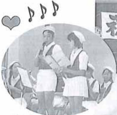
榊浜小金管バンド演奏 (4・5・6年19名)