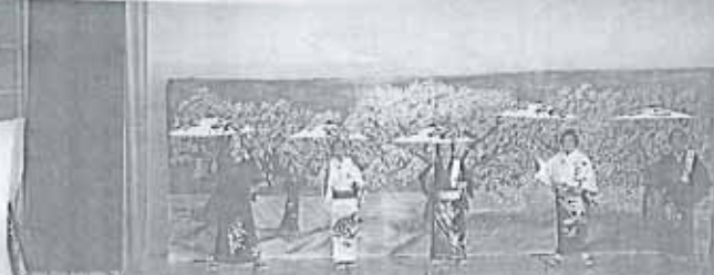
八千代座歌舞伎一座 演題『弁天娘 女男白浪』