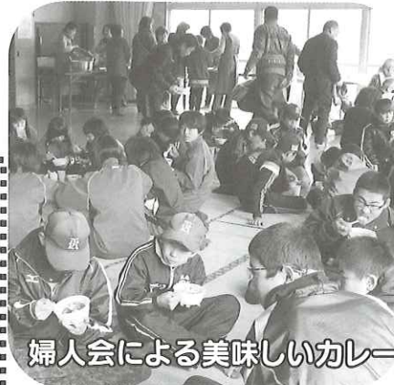
婦人会による美味しいカレー

小学校では、この季節インフルエンザも流行し、学級の児童がそろわなくて、授業もいつも通りの速さで進めるのが難しくなります。また、学校で一番大切な行事である「卒業式」を前に子どもたちにも緊張感が高まってくる時です。学習のまとめの時期を迎え、教職員は、学年の最後にこれだけの力はつけさせておきたい、経験させておきたいと、それは、焦りにも似た不思議な雰囲気醸し出しています。本当にあっという間に時が流れます。