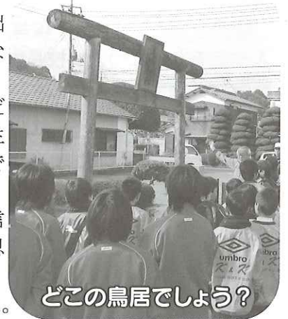
どこの鳥居でしょう?