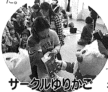
サークルゆりかご (社・民・児・公・母)

恒例の「クリスマス会」 が行われました。79組 の親子が参加し、ミルキ ーウェイさんの歌に合 わせ、踊ったり歌った り、楽しいひとときで した。