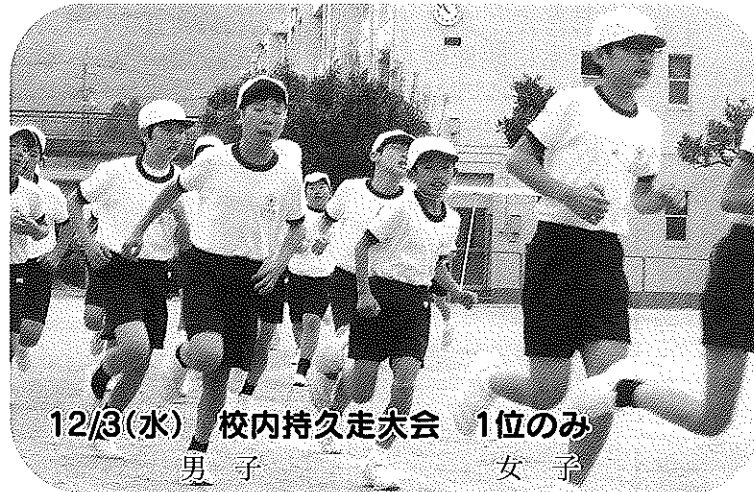
12/3(水) 校内持久走大会 1位のみ