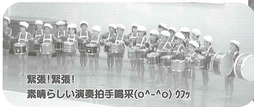
緊張!緊張! 素晴らしい演奏拍手喝采(o^-^o) ヲツ