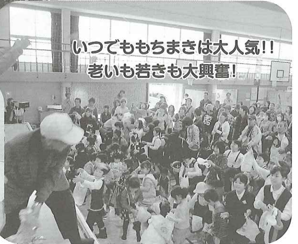
いつでももちまきは大人気!! 老いも若きも大興奮!