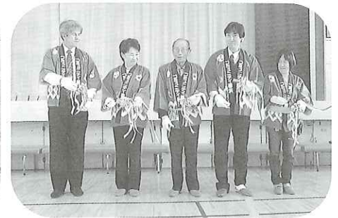
文化祭にここにスタート 気持ちを合わせてテープカット