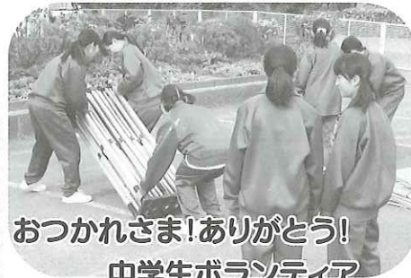
おつかれさま!ありがとう! 中学生ボランティア

驚原八幡宮にある全長270mの広大な流鏝馬(やぶさめ)の馬場は、日本でただ一つ原型を残す横馬場形式であり、島根県の史跡に指定されています。この馬場で行われる古式豊かな流鏝馬神事は、鎌倉時代の狩装束をつけた射手が疾走する馬上から三つ的を射る迫力ある神事です。