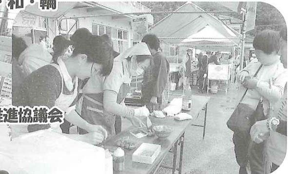
おいしい たこやきを求めて長い 行列何処までも\(^▽^)/