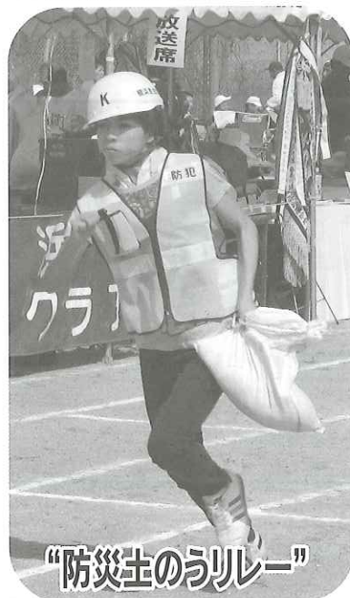
“防災士のうリレー”