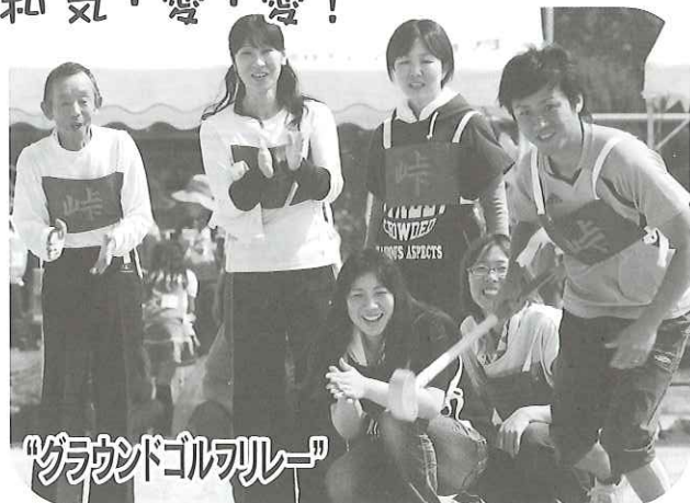
“ゴルフボールリレー”