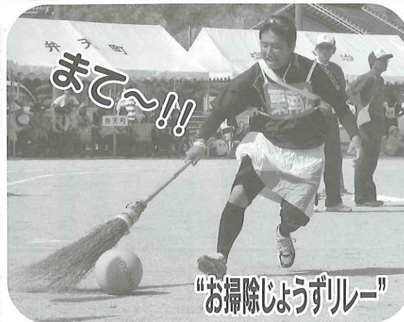
“お掃除しようずリレー”