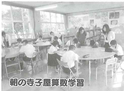
朝の寺子屋算数学習