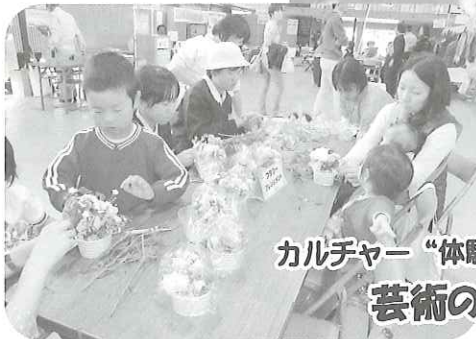
カルチャー“体験” 芸術の広場