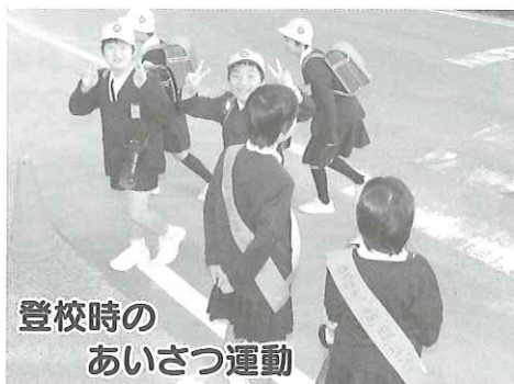
登校時の あいさつ運動