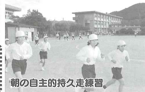
朝の自主的持久走練習