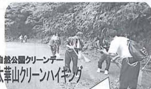
自然公園クリーンデー 太華山クリーンハイキング