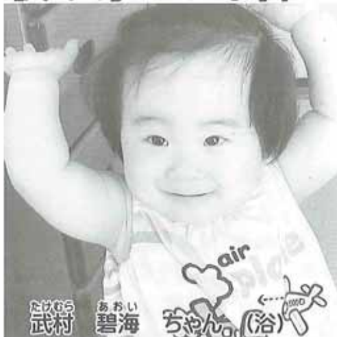
お返事ができるようになったよ!