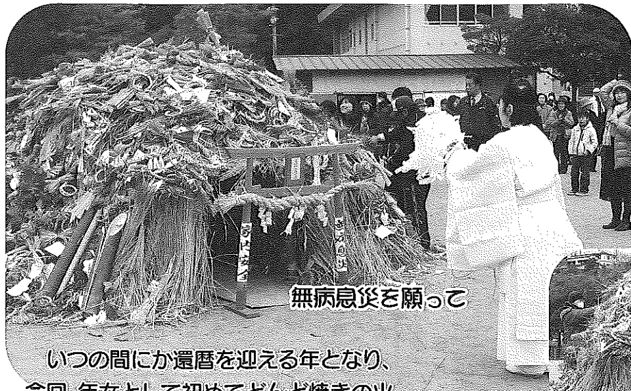
無病息災を願って

いつの間にか還暦を迎える年となり、今回、年女として初めてどんど焼きの火をつけさせて頂きました。