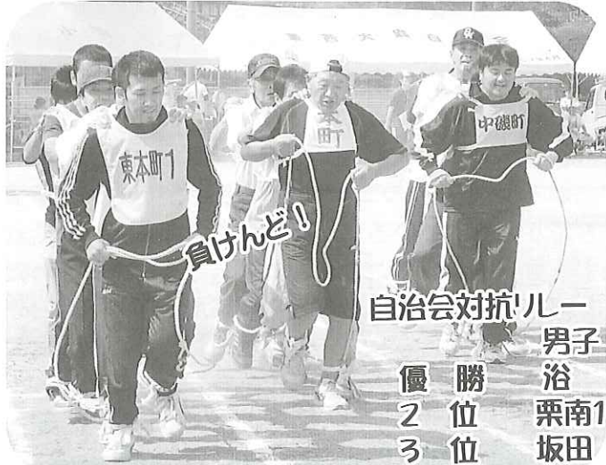
自治会対抗! ルー 男子 優勝 浴 2位 栗南1 3位 坂田