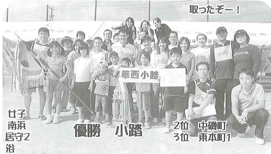
女子 優勝 小踏 2位 中磯町 3位 東本町1 浴