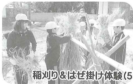
稲刈り&はぜ掛け体験(5年)

タイル磨きを終えた3年の男の子は、洗面台をきれいにし始めました。便器磨きを終えた6年の男の子は、トイレットペーパーをセットしています。最後に、二人でごみ箱に新しい新聞紙の袋のセットし、スリッパを整頓して終了です。