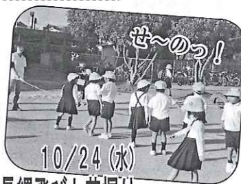
10/24(水) 長縄飛びと芋掘り

などの遊び歌に乗せて縄を飛びました。2年生は畑で芋を掘り、たくさん芋を見つけました。