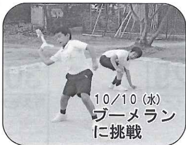
10/10(水) ブーメランに挑戦

10月の子ども教室は、厚紙でブーメランを作って、飛ばしました。色とりどりのブーメランが空を舞いました。また、みんなで長縄飛びをして、「郵便屋さん」