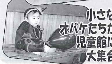
小さなオバケたちが児童館に大集合