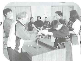
緊張の卒団証書授与