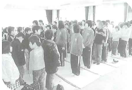
対面式 入団者二一五名